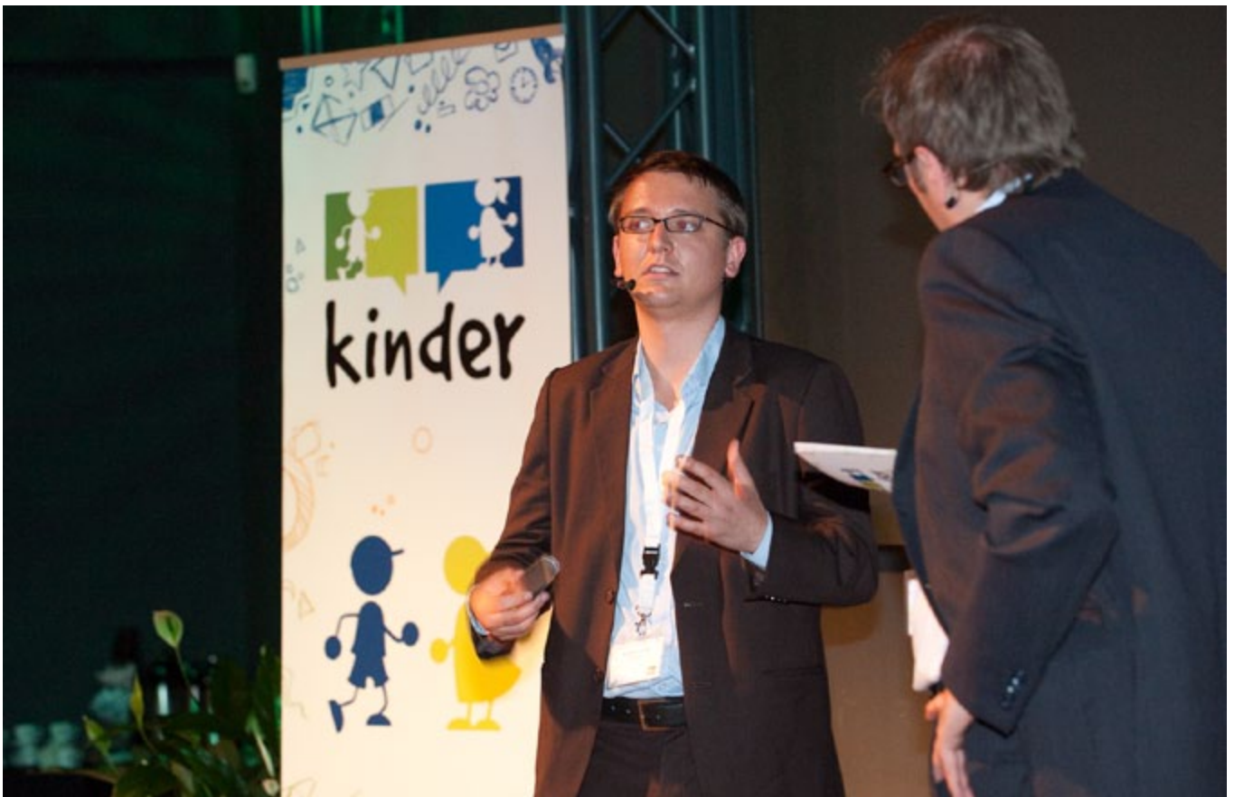
KINDER 2010, Köln 2010