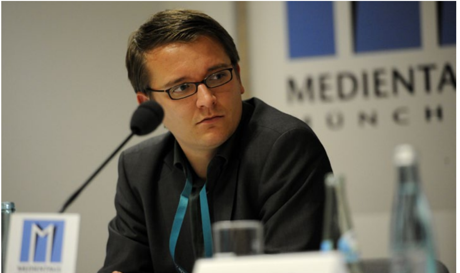
Medientage München, München 2010