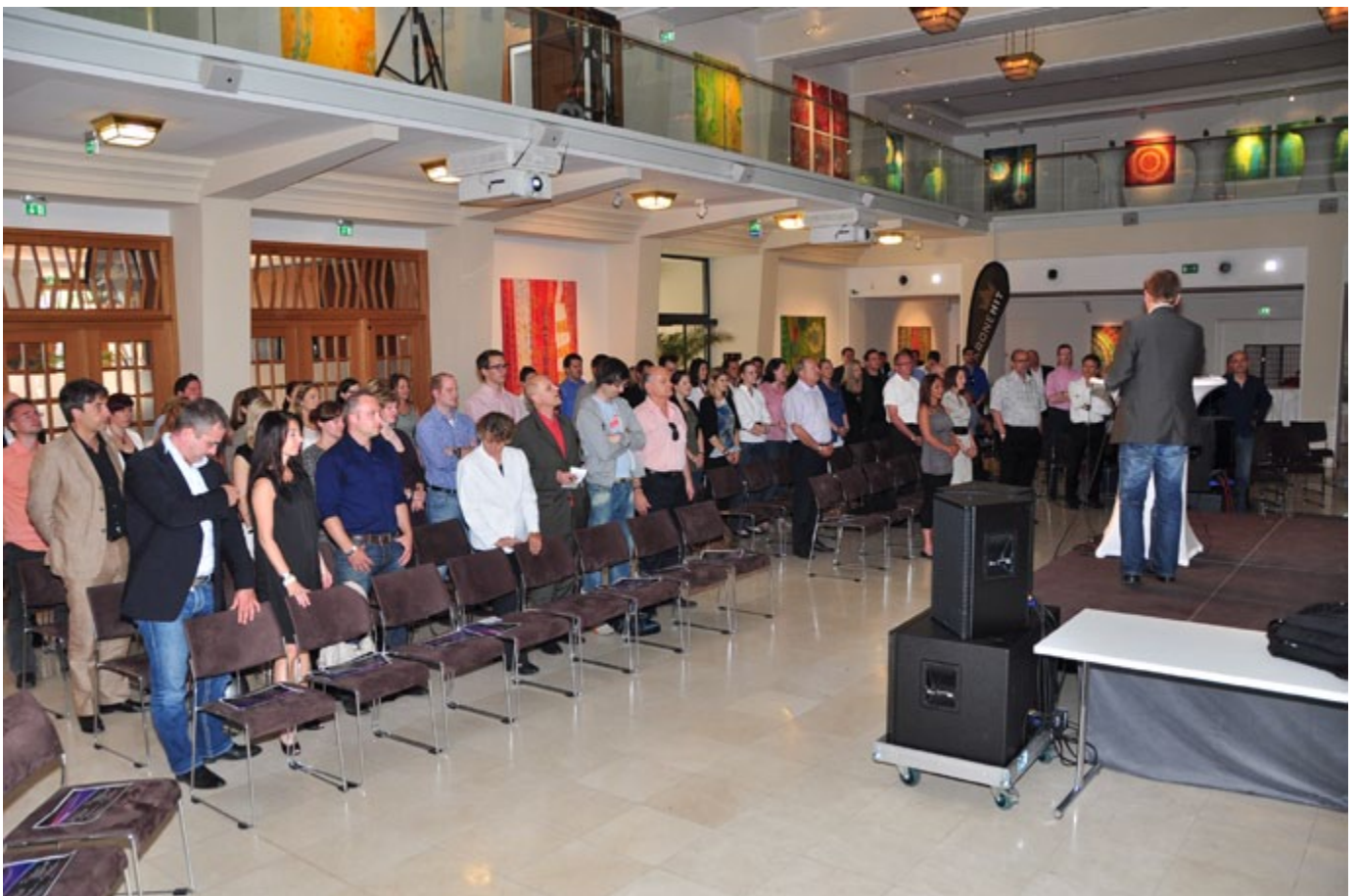
Kronehit Radioday, Wien 2011