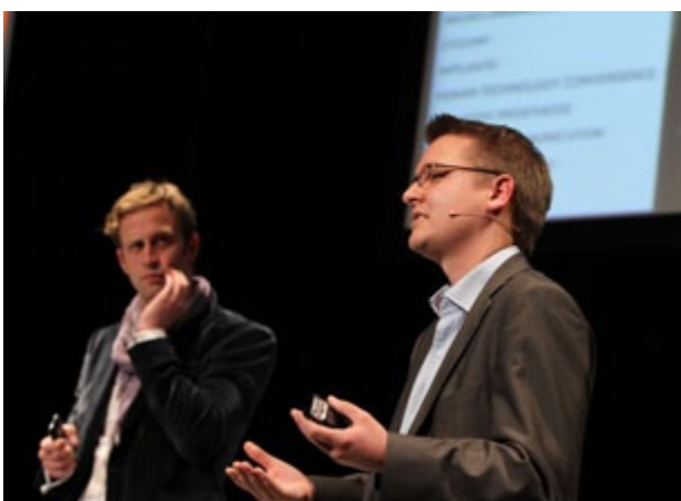
TEDxYouth Berlin und TedxBerlin, Berlin 2010