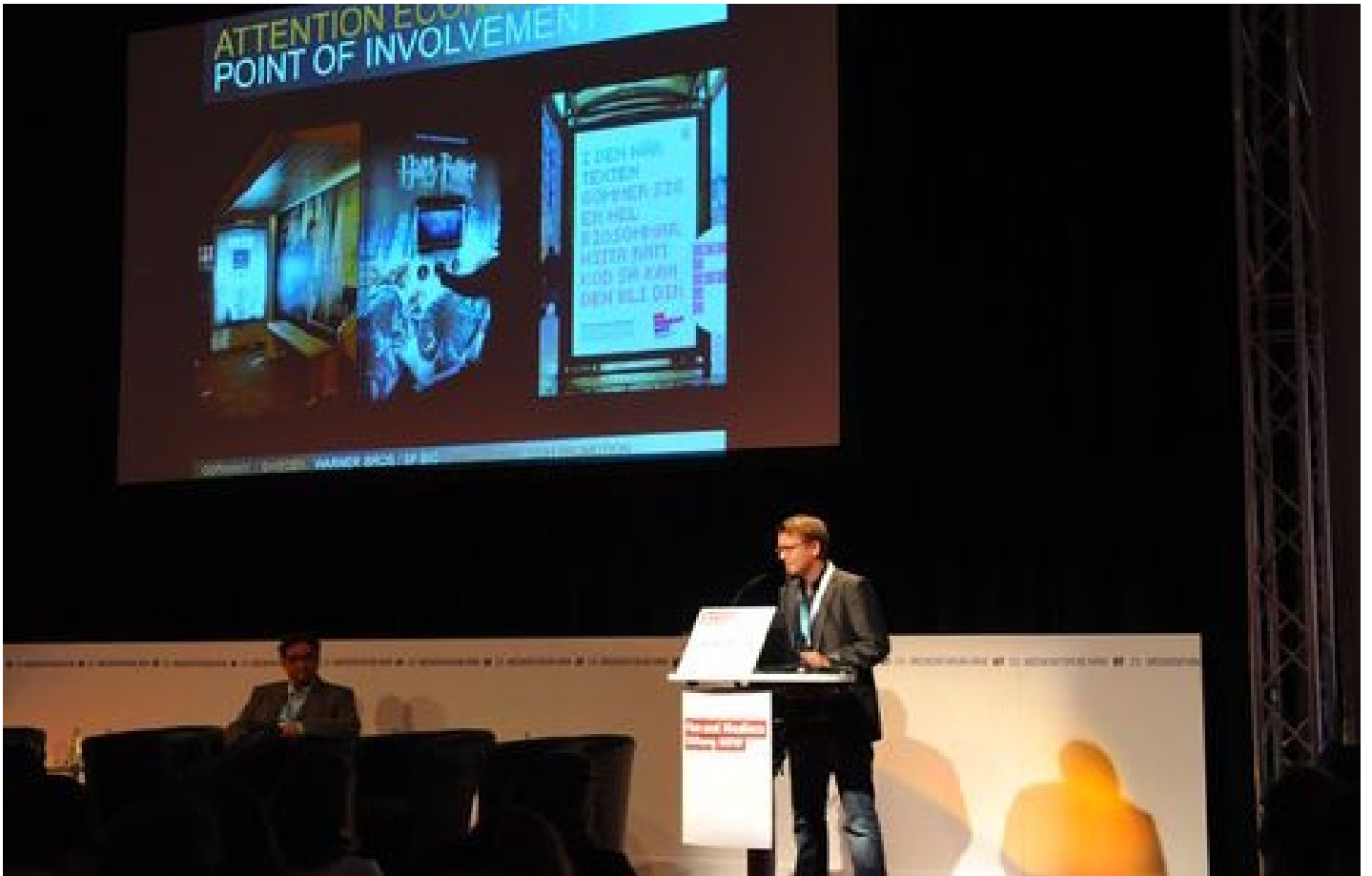
Medienforum NRW, Köln 2011